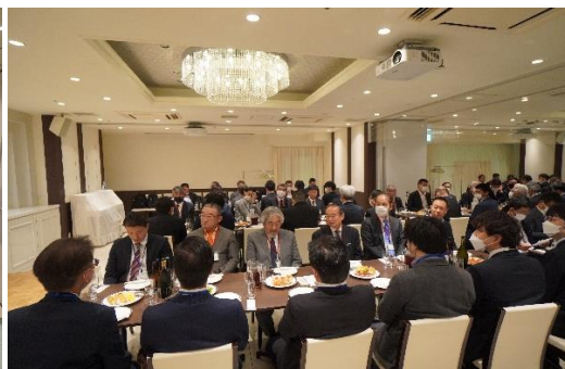
(昨年の総会懇親会風景…出席者100名)