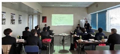
講習室で会社の概要説明と質疑応答