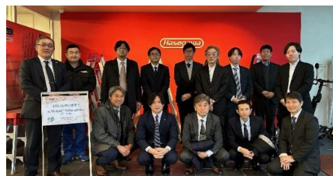
(工場内ロビーで記念撮影)