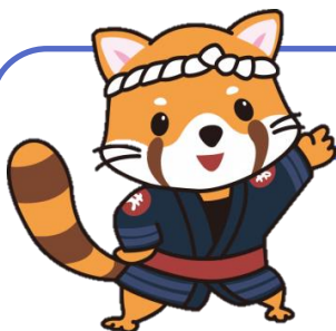
イメージキャラクター 共助くん