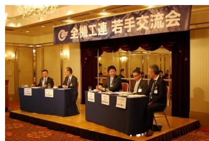
「働き方改革」シンポジウム