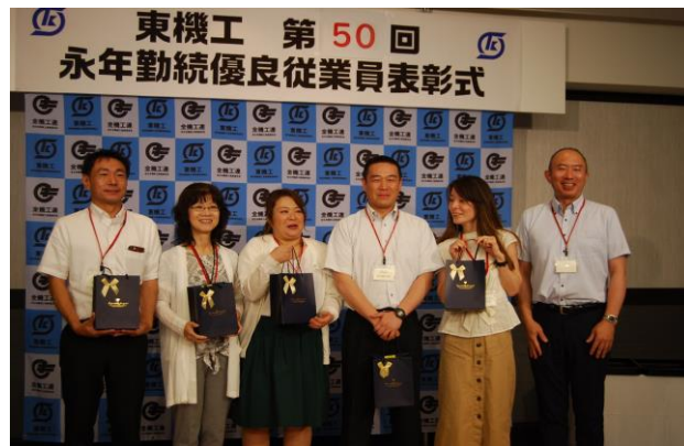
(第50回永年勤続優良従業員表彰式)