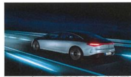
Mercedes-EQ, EQS 580 4MATIC

1987年 メルセデス・ベンツ日本株式会社 入社 2003年 常務取締役役に就任 2007年 代表取締役副社長に就任 2012年 代表取締役社長兼 CEO に就任